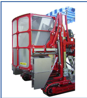
●R形状背面コンテナ