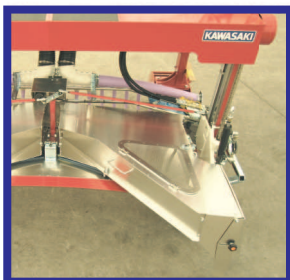
●乗用型刈均ダクトJKD