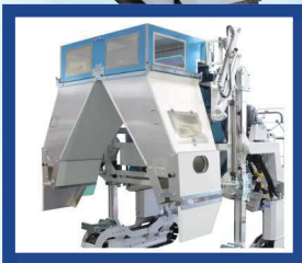
●浅刈対応シュート