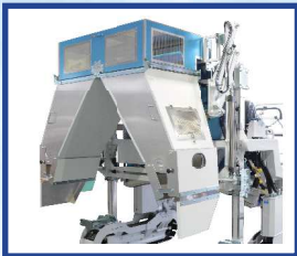
●浅刈対応シュート