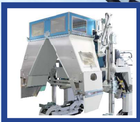
●浅刈対応シュート