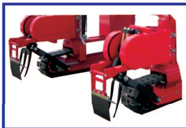
●鋤式深耕機 (オプション)