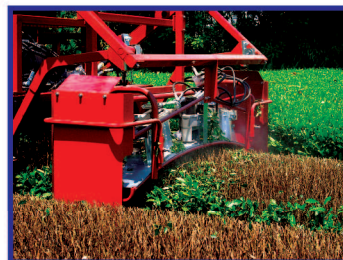
●後方剪枝装置 (オプション)

※機械の改良に伴い、予告なく仕様及び外観を変更することがありますのでご了承ください。