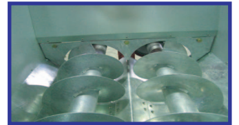
●バケット内スクリュウ部