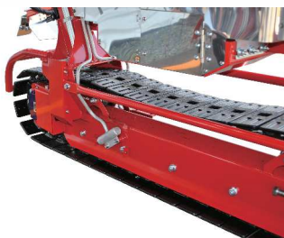
●カイガラ防除 (オプション)