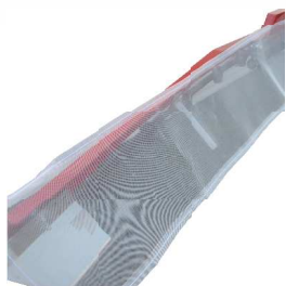
●飛散低減カバー (オプション)