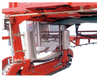
●自動走行装置 (オプション)