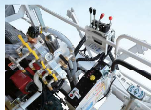
●コントローラー部