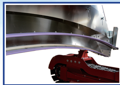
●2段刈摘採ユニット