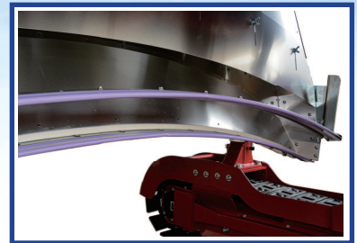
●2段刈摘採ユニット