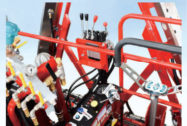
●コントローラー部